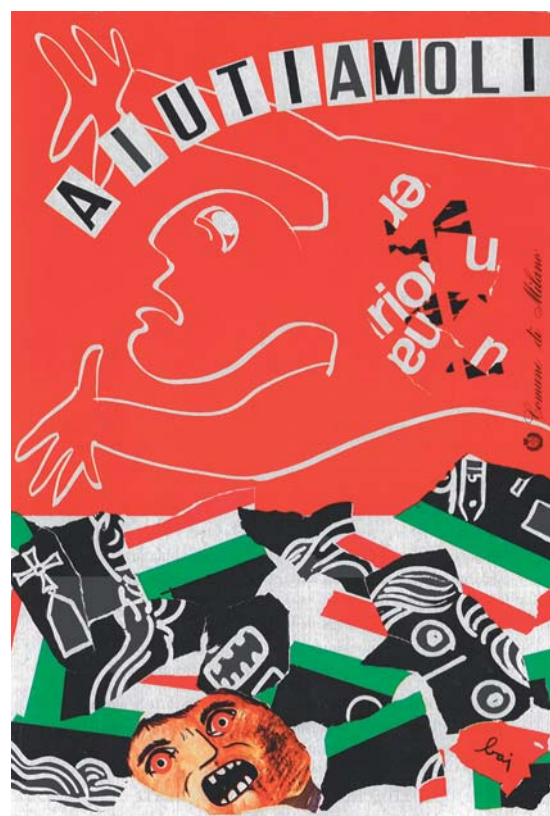
Enrico Baj, Aiutiamoli , 1980 Manifesto, 102 x 72 cm - Collezione privata

L'esposizione, itinerante, ripercorre i territori colpiti nell'ultimo secolo da alcuni dei principali eventi della storia sismica italiana, ospitando prestigiose opere provenienti da tutta Italia, grazie alla collaborazione di musei, archivi, biblioteche, gallerie pubbliche e private.