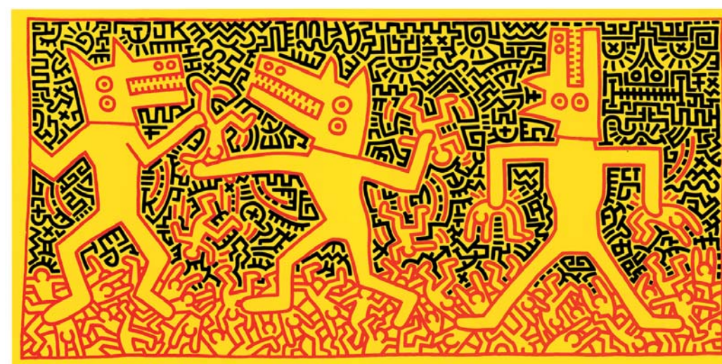
Keith Haring, Senza titolo , 1983, Acrilico su tela, cm 290x590, Palazzo Reale di Caserta