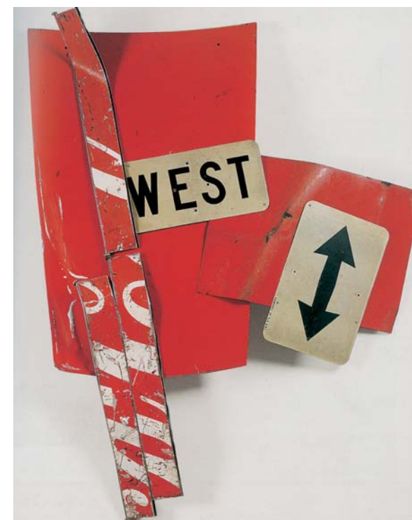
Robert Rauschenberg, West Go Ho (Glut) , 1986 Metallo assemblato, 212 x 165 x 27 cm Palazzo Reale di Caserta, Collezione Terrae Motus