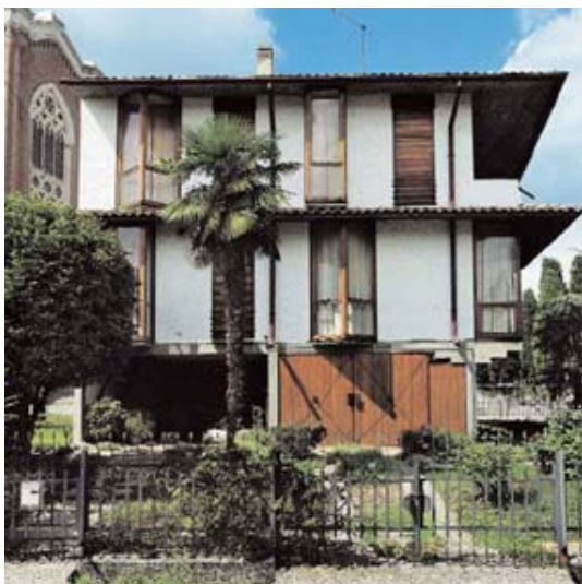
casa Tesser a Montebelluna (TV) – 1961