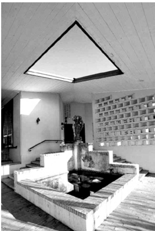
scuola materna a Sala di Istrana (TV) – 1965