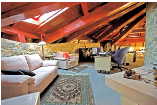
casa Causarano a Marostica (VI) – 1967