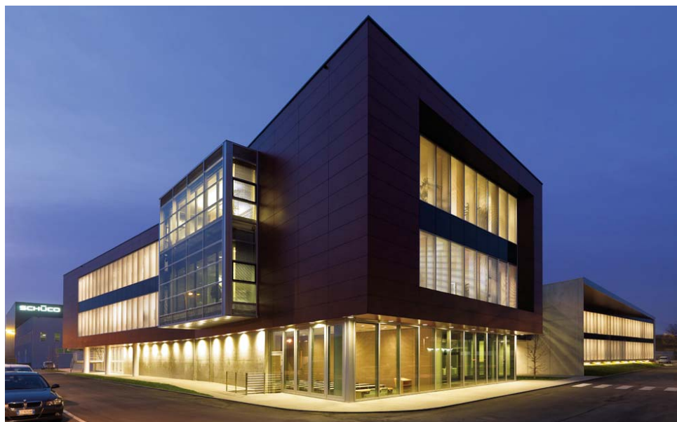
La nuova sede di Schüco International Italia, progetto B+B associati.

Per info sulla fase internazionale del premio: Architecture & Children Work Programme www.uiabee.riai.ie .