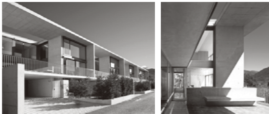
127 Casa Vignascia, Minusio

Il volume intitolato Arnaboldi , pubblicato dalla casa editrice Birkhäuser di Basilea, accompagna la mostra e costituisce la prima monografia sull'architetto, presentando l'intera opera finora realizzata.