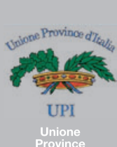
Unione Province d'Italia