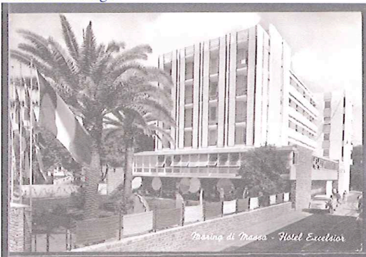
Excelsior fine anni'60