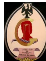
Collegio dei Geometri della provincia dell'Aquila

Ordine degli Architetti Pianificatori, Paesaggisti e Conservatori della Provincia dell'Aquila