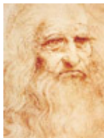
Ordine Ingegneri della Provincia dell'Aquila