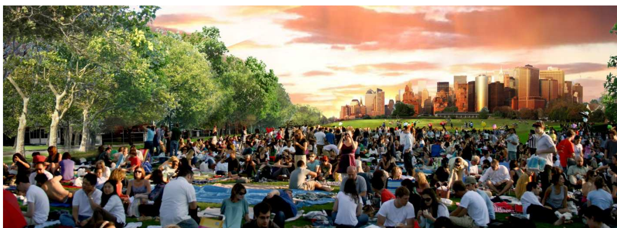
Governors Island ©West 8

Weijts è particolarmente interessato a scoprire e sviluppare concetti innovativi e tipologie in materia di urbanistica e architettura e li applica, se possibile nei suoi disegni.