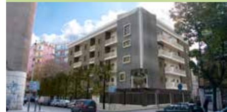
Palazzo Ciuffreda - Edilizia plurifamiliare CasaClima A - Foggia