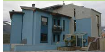
Edificio Spinamare, Complesso Residenziale CasaClima Gold - Pignola (PZ)