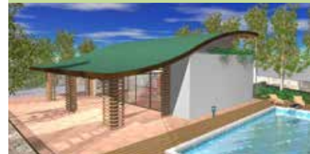
Villa Minerva, Residenza unifamiliare CasaClima Gold - Ruvo di Puglia