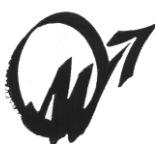
Collegio dei Periti Industriali e dei Periti Industriali Laureati della provincia di Modena