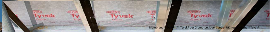
Membrana in DuPont™ Tyvek® per Crompton Sport Centre, UK; foto: DuPont™ Tyvek®.