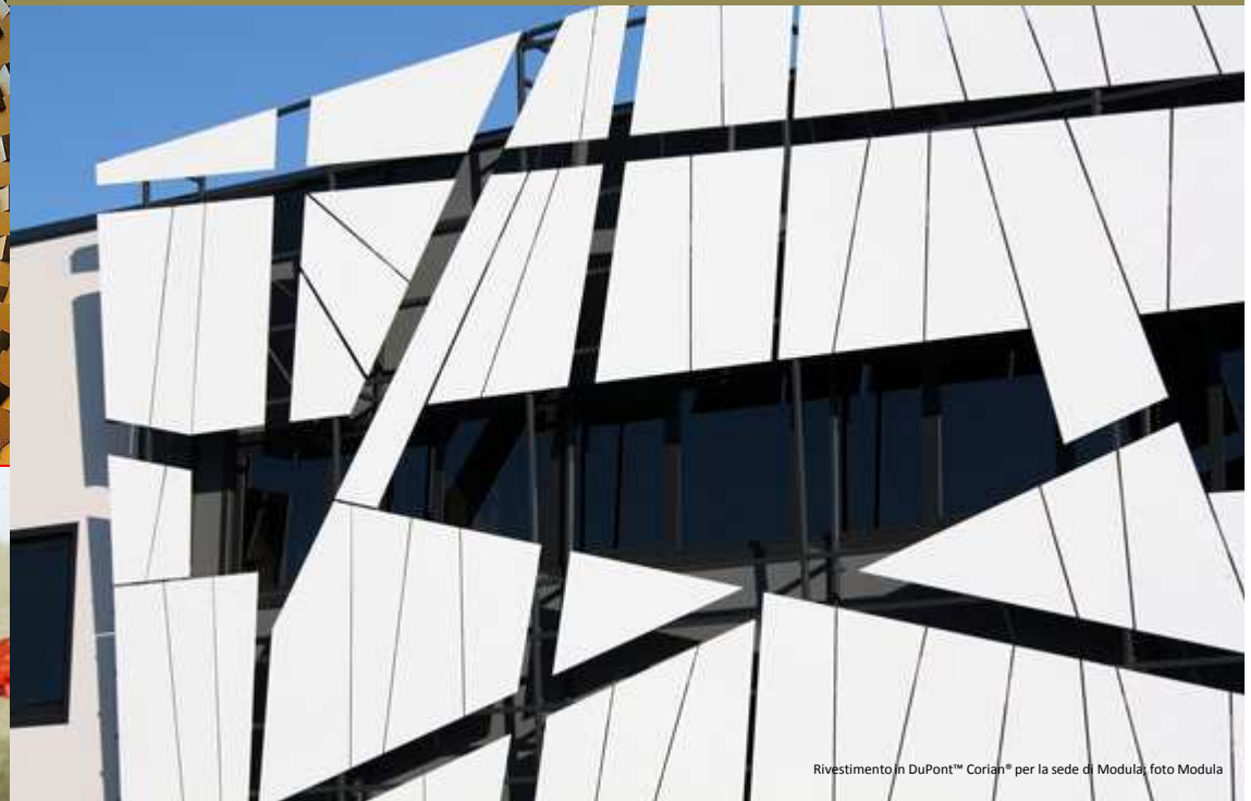
Rivestimento in DuPont™ Corian® per la sede di Modula