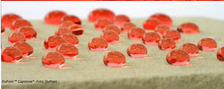
DuPont™ Capstone®