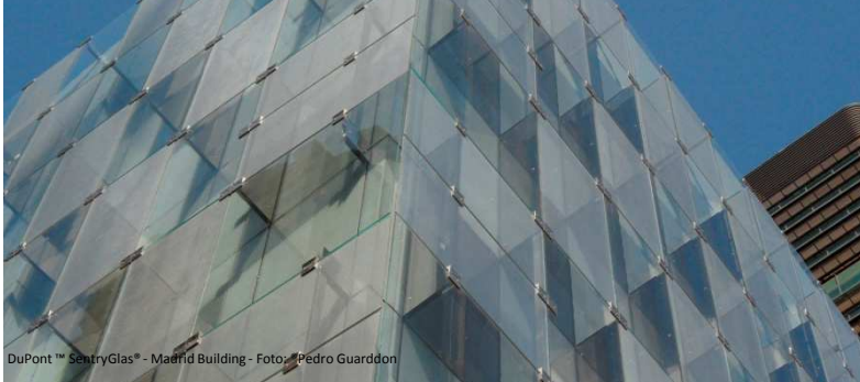
DuPont™ SentryGlas® - Madrid Building - Foto: Pedro Guarddon