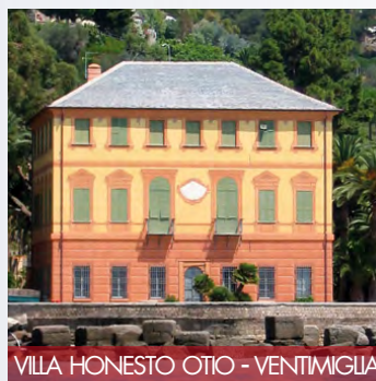
VILLA HONESTO OTIO - VENTIMIGLIA