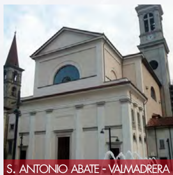
S. ANTONIO ABATE - VALMADRERA