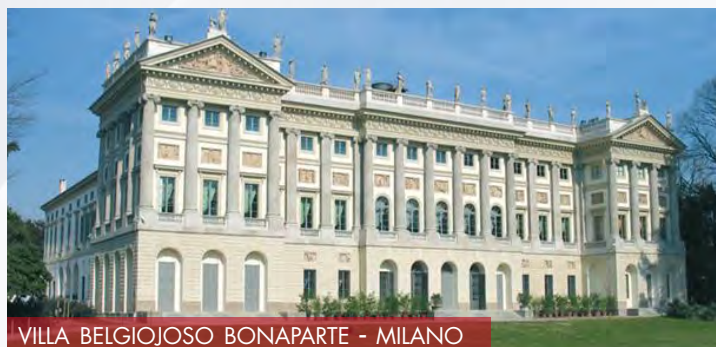
VILLA BELGIOJOSO BONAPARTE - MILANO