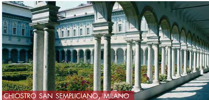
CHIOSTRO SAN SEMPLICIANO, MILANO