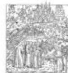
Ordine degli Ingegneri della Provincia di Bergamo