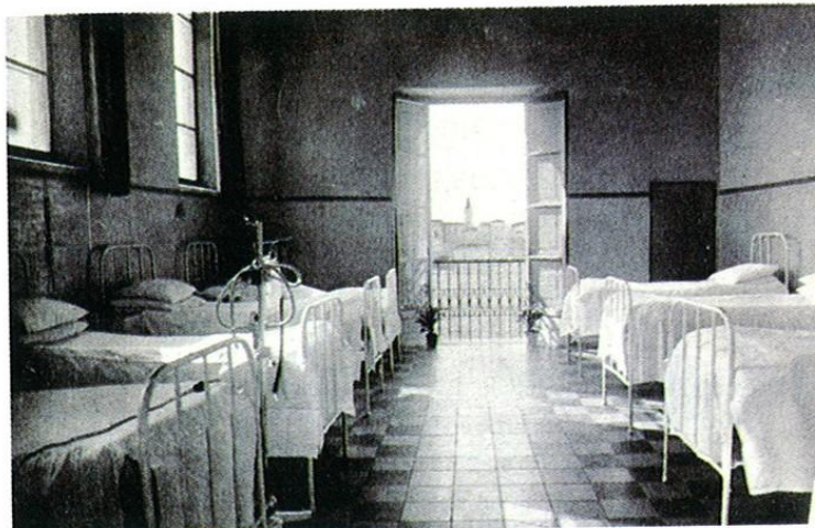
Sala degenza in una foto del 1951