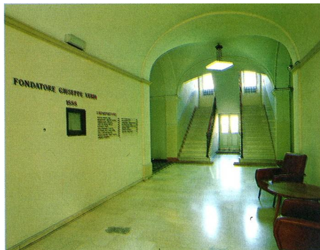
Ingresso Ospedale storico

Dall'impegno e dalla passione è nata un'associazione sportiva composta dagli ex pazienti del centro.