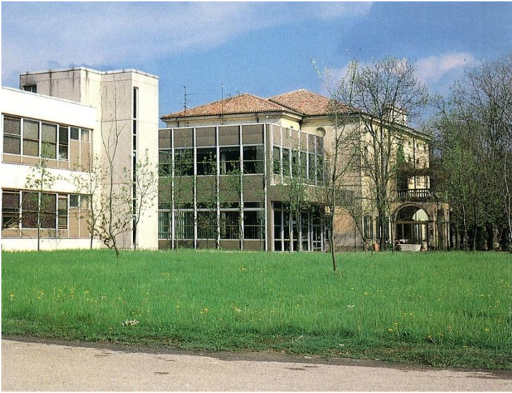
La moderna costruzione dell'Ospedale