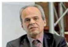
Top Leopoldo Freyrie, presidente Consiglio nazionale architetti

sta leggere i numeri delle altre categorie (biotecnologie escluse dove le donne rappresentano ben il 76%) per capire quanto sia «rosa» l'architettura italiana: oscillano tra il 2