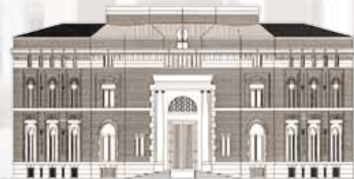
Prospetto della Casa Madre dei Mutilati